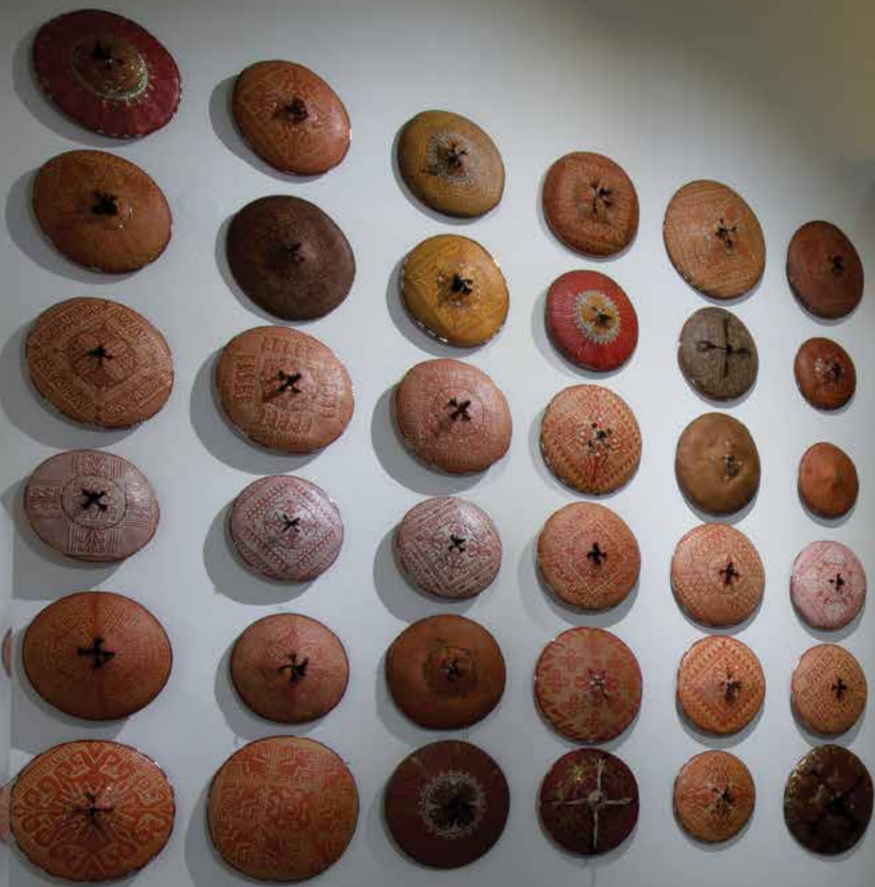
Immagine d'insieme di cappelli cerimoniali "Sapuyung daré" e "metò" del Borneo presentati nell'esposizione "Dayak. L'arte dei cacciatori di teste" al MUSEC di Lugano dal 27 settembre 2019 al 7 giugno 2020.

Oltre che nelle cerimonie, i cappelli erano impiegati anche in importanti ritualità svolte per onorare i rapporti di reciprocità tra gli individui o tra i villaggi. Le immagini di cappelli cerimoniali "Sapuyung daré" nelle pagine seguenti sono tratte da Paolo Maiullari, "Sapuyung. Cappelli cerimoniali del Borneo", Edizioni Mazzotta, Milano, 2011.