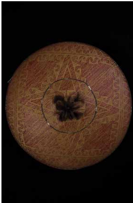
Foto a sinistra: Cappello cerimoniale raffigurante il motivo decorativo della pianta “pahakung” collocata entro una cornice circolare di “putak hanyut”, che rappresenta la schiuma del fiume in piena che spinge alla deriva .