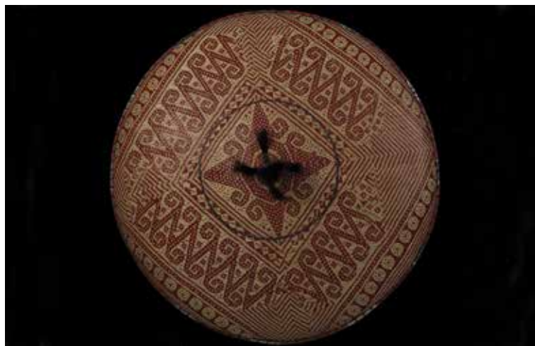
Foto: Cappello cerimoniale con motivo decorativo del sole, fonte di energia , di vita e di prosperità .

re bancario, che, come visto sopra ha subito un'importante ristrutturazione. Se le loro ridotte dimensioni 6 , da una parte portano maggiore flessibilità e prossimità al cliente, completando così il sistema in un'ottica di distretto ticinese di servizi finanziari 7 , dall'altra parte, in una realtà dove, come visto, i costi "normativi" e tecnologici aumentano esponenzialmente, sono sintomo di grande fragilità. È in quest'ordine d'idee che, per la prima volta nel 2016, il loro numero è iniziato a diminuire. Questa tendenza verrà probabilmente accentuata con l'entrata in vigore quest'anno delle nuove leggi federali sugli istituti e i servizi finanziari, che sottopongono i fiduciari finanziari (definiti nelle nuove leggi gestori di patrimoni individuali) a condizioni più stringenti. Ma sarà verosimilmente in un quadro di maggiore specializzazione e collaborazione che potranno ritrovare un loro specifico ruolo. I conglomerati finanziari specializzati sopra descritti faciliteranno la sopravvivenza anche di entità di dimensione ridotta, purché portatrici di specifiche e originali competenze geografiche o economiche, oppure giuridiche, o altro ancora.